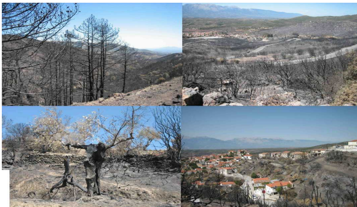
Εικόνα 1: Πυρόπληκτες περιοχές στη λεκάνη απορροής του ποταμού Ευρώτα: α) δάσος κοντά στο Πολύδροσο, β) χορτολιβαδική έκταση στα Χρύσαφα, γ) ελαιοκαλλιέργειες και δ) χωριό Χρύσαφα.