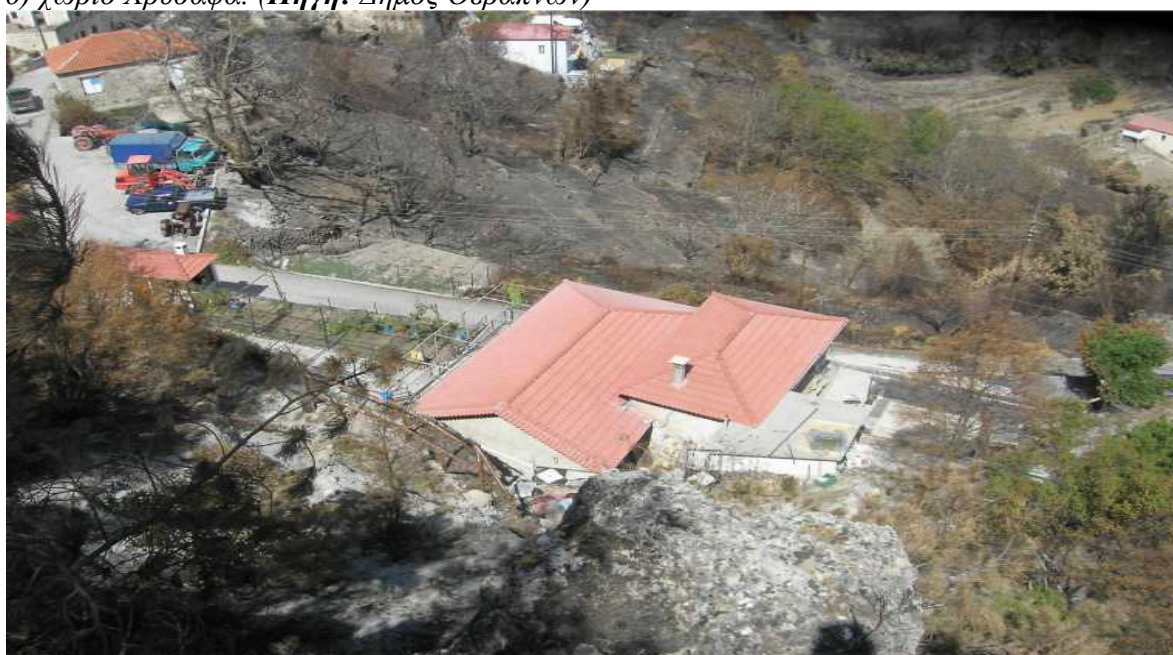
Εικόνα 2: Το Τοπικό Διαμέρισμα των Αγριάνων μετά τις πυρκαγιές του Αυγούστου 2007

Για την ανάκαμψη της κοινωνικής και οικονομικής ζωής του τόπου μετά την πυρκαγιά και για να αποφευχθεί το ενδεχόμενο μείωσης του πληθυσμού από την μετανάστευση των νέων στα αστικά κέντρα κρίνεται αναγκαία η δημιουργία συνθηκών για τη δυνατότητα ανάπτυξης του τόπου μέσω της παροχής κινήτρων στον